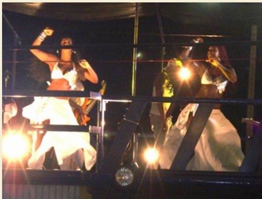
Enorme trailere med scene på toppen, sangere, enorme høytaleanlegg og lysutstyr

kanskje en dusj – men viktigst er en kraftig generator som kan gi strøm både til "scenelyset" på toppen og til