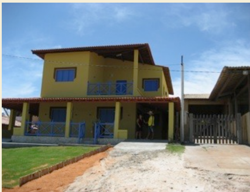
Det gamle feriehuset er erstattet av et nytt og større byggverk

Men alle papirer for ferieboligen er i orden, byggetillatelse er godkjent i kommunen og dermed står bygget der slik dere kan se på bildet.