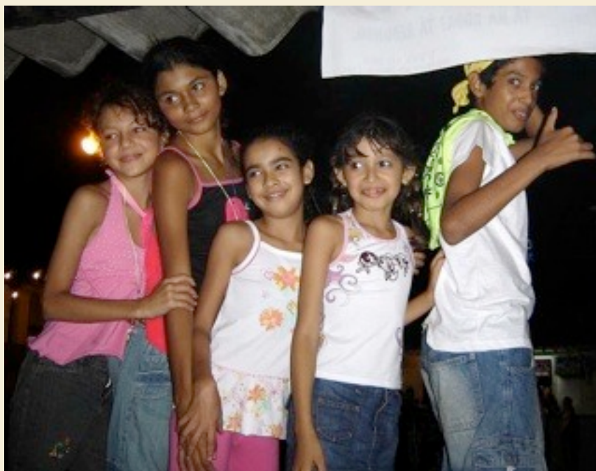
Også en folkefest som inkluderer de mindre. Her fra Carnatal i 2008

også til ytre avkjøling – ikke bare på egen kropp, men de nærmeste blir også dusjet