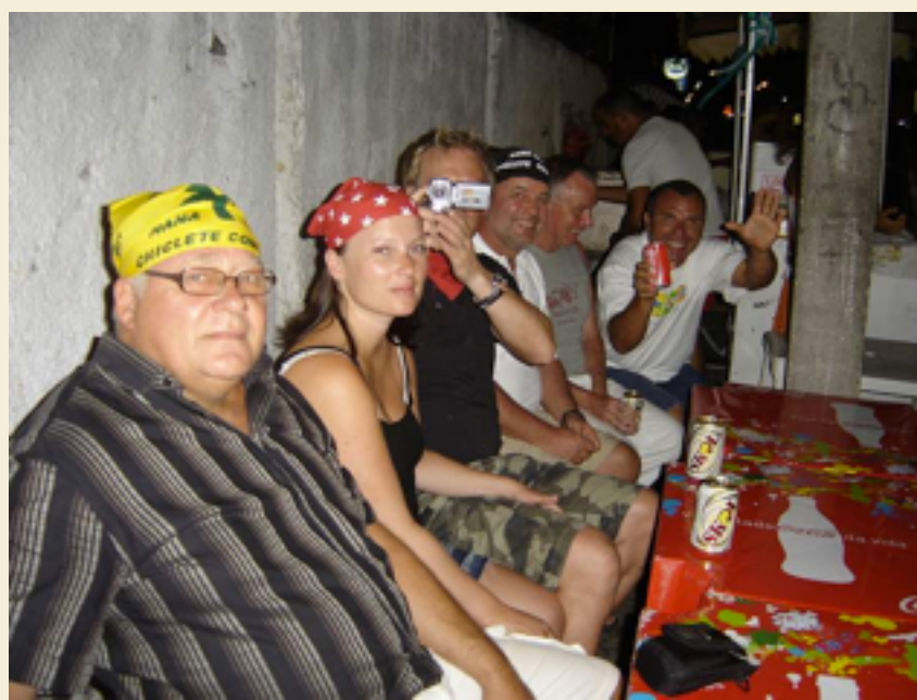
Recantofolk på Carnatal i 2008

gang, og således lettere utholde en tilværelse som ikke alltid er like enkel.